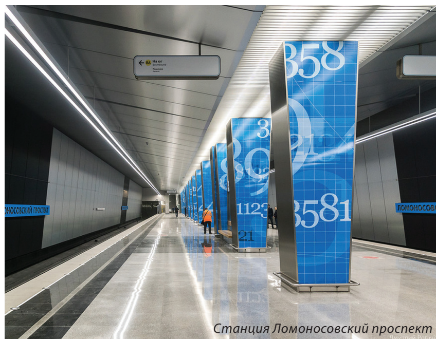
Станция Ломоносовский проспект